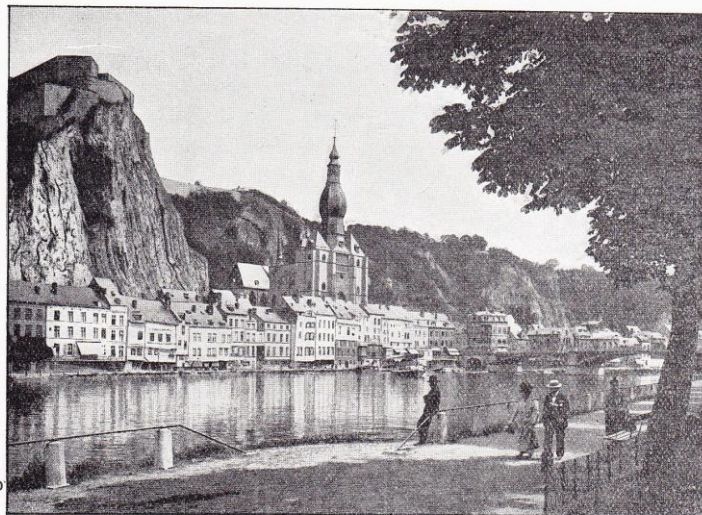
Dinant. — Vue générale.